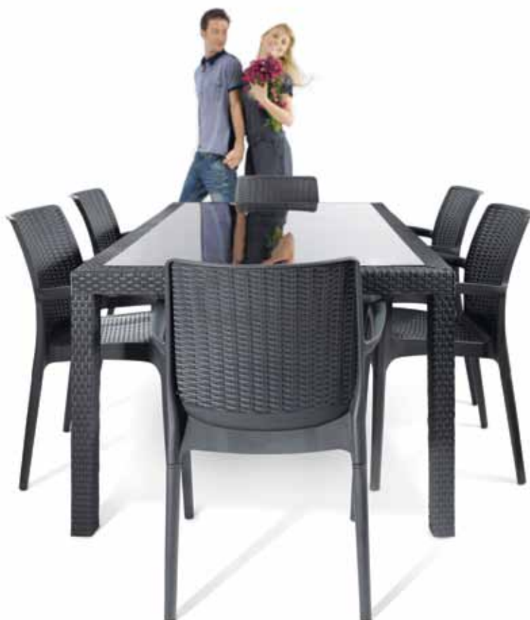
17189854 SAMOA Table