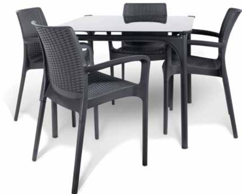
17190711 JAVA Table

Additional products in the series • Produits supplémentaires dans cette série Zusätzliche Produkte in dieser Serie • Πρόσθετα προϊόντα της συγκεκριμένης σειράς Bijkomende producten in deze serie • Productos adicionales en esta serie